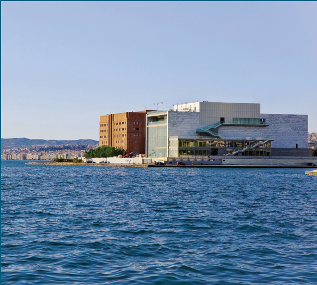
Μ2 Μέγαρο Μουσικής Θεσσαλονίκης