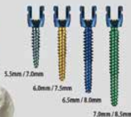
Dual Outer Diameter