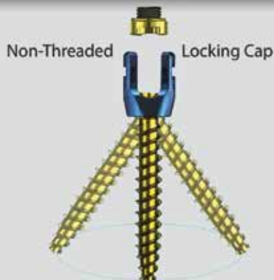
70° Polyaxial Angulation